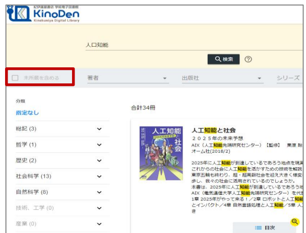
所蔵タイトルのみ

「未所蔵を含める」にチェックを入れると、本学にない電子書籍についても、内容紹介を確認し、試し読みをすることができます。