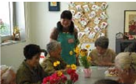
デイサービスで利用者とふれあう

訪問介護員に同行していただくだけでなく、訪問入浴車に同乗させていただいたり、在宅介護支援センター職員に同行して訪問介護を行ったり、介護予防・生きがい対策事業に参加させていただくなど、充実した内容となっています。質の高い生活支援のできる介護福祉士を目指し、様々な居宅サービスを体験し、多くのことを学び取ることが目的の一つです。学生は、利用者一人一人に、それぞれ異なったニーズや生活環境があることを理解します。ひとりひとりの利用者にあつた個別ケアを提供するために、介護福祉士としての確かな技術と、人が人にケアを提示するための豊かな人間性を持つことの大切さを肌で感じていきます。