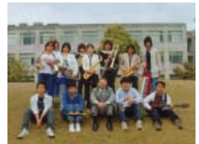
ウインド・オーケストラ