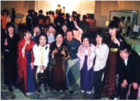
皆、晴れやかな笑顔で

引き続き、一年生の企画・運営で焼津市内のホテル松風閣において卒業パーティが開催されました。社会に巣立つ前の和やかなひと時、卒業の喜びを友人、教職員と分かち合いました。