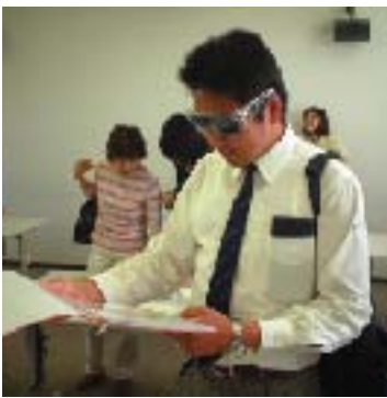
福祉情報学科の視覚障害体験コーナー

障害があるなしにかかわらず誰もが自分らしい生き方を選択し、社会参加できる。そんな福祉社会を支える人材を育むために、福祉情報学科は優秀な教授陣と優れたカリキュラムを用意し、学生のモチベーションに応えます。