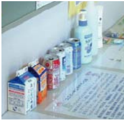
ユニバーサルデザイン商品展示

現在は、第二回「ユニバーサルデザインについて学ぼう展」(六月二〇日～八月三十一日)を開催中です。ユニバーサルデザインに基づき開発された商品やさまざまな資料が展示されているほか、第六回しずおかユニバーサルデザインアイデアコンクール(事務局静岡県ユニバーサルデザイン室)への学生からの応募作品を図書館でとりまとめています。皆さんからの素敵なデザインをお待ちしています。ふるってご応募ください。